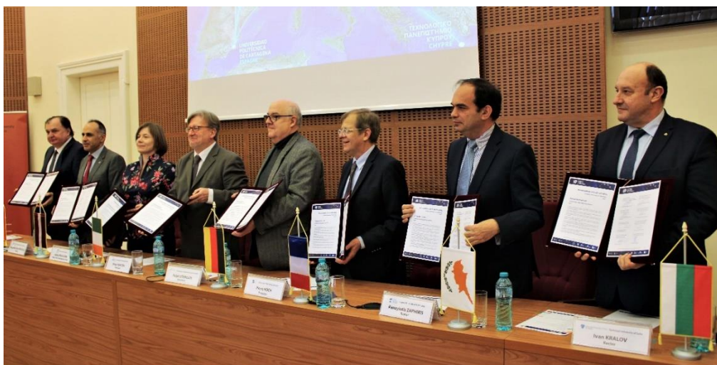
Les présidents et recteurs des huit universités de l'Alliance portant le Memorandum of Understanding

L'Université de technologie de Troyes (UTT) coordonne cette initiative d' Université de technologie européenne, EUt+ avec une ambition renforcée : créer à terme une institution, basée sur un modèle original, permettant à chacun de développer son potentiel à travers l'Europe. Avec ce projet, les partenaires s'engagent à créer un avenir durable pour les étudiants et apprenants des pays européens, les collaborateurs de chaque établissement et pour les territoires qui accueillent chaque campus.