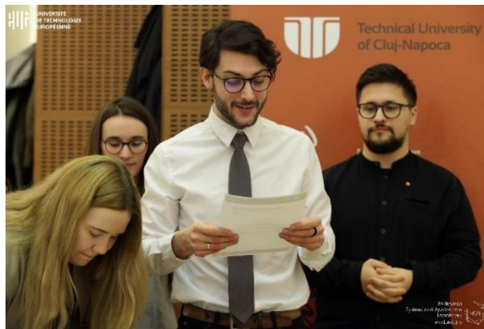
Étudiants troyens, roumains et allemands lisant la déclaration d'intention des étudiants