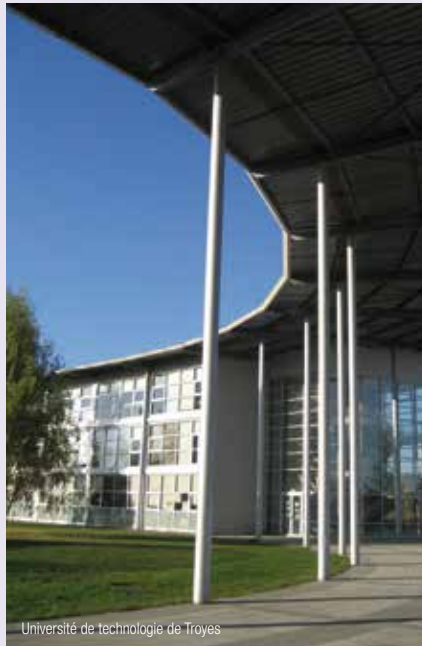
Université de technologie de Troyes