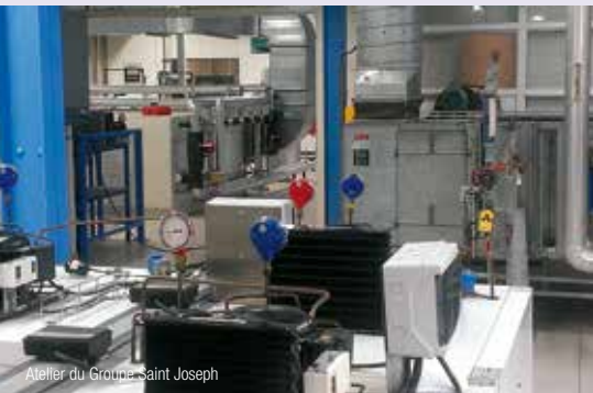
Atelier du Groupe Saint Joseph