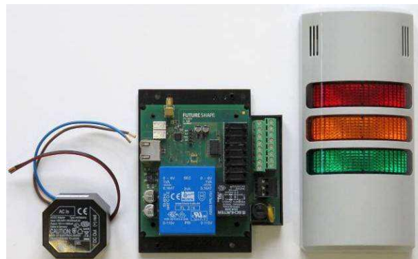
Figure 3. Emetteur-récepteur SensFloor SE10-H est basé sur une carte Raspberry Pi avec un socle sur boîtier rail DIN avec 8 relais statiques pour l'intégration au sein de systèmes d'automatisation d'un bâtiment ou du domicile.